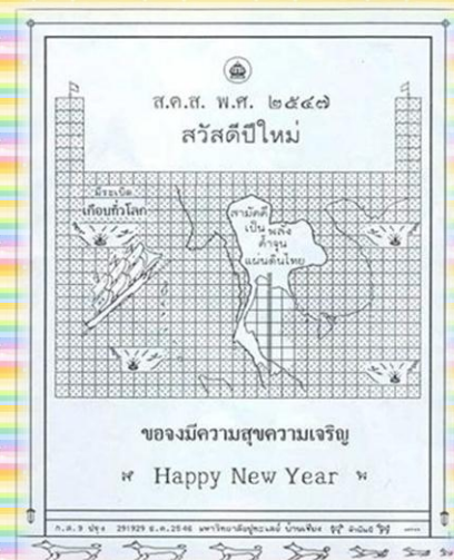
ส.ค.ส.พระราชทาน ปี พ.ศ.2547

ในส่วนของคุณความที่ปรากฏบน ส.ค.ส. พระราชทานนั้น ล้วนสอดคล้องเกี่ยวข้องกับ เหตุการณ์บ้านเมืองในปีนั้นๆ และแม้จะเป็นเพียง ถ้อยคำสั้น ๆ แต่ก็แฝงไปด้วยข้อคิด และคติเตือนใจ ที่ส่งผ่านไปยังปวงชนชาวไทยทุกคน