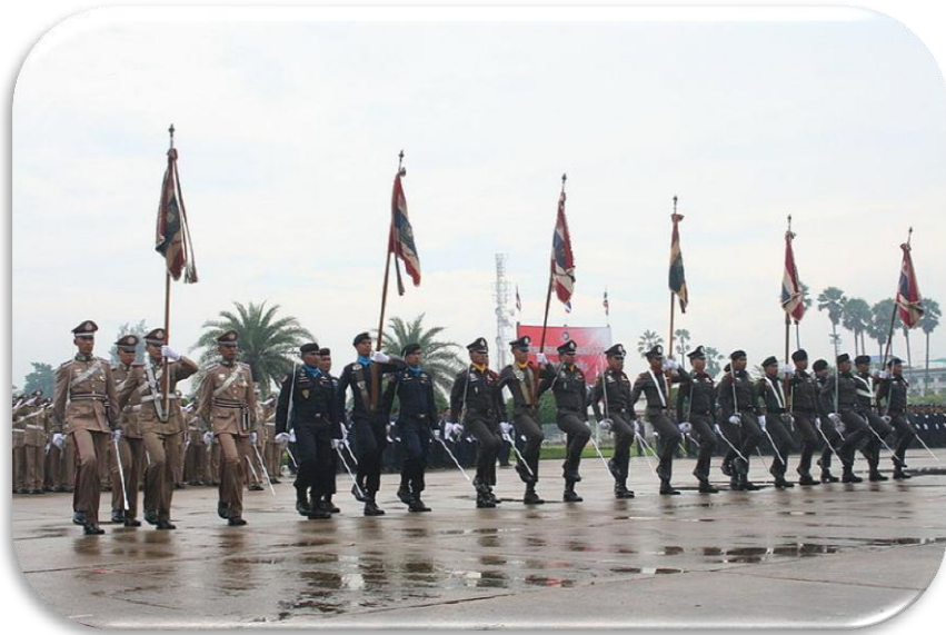
พิธีสวนสนาม วันตำรวจ

สำหรับการประกอบพิธี วันตำรวจ อย่างเป็นทางการครั้งแรก เกิดขึ้นเมื่อวันที่ 13 ตุลาคม พ.ศ. 2492 ในสมัยที่ พล.ต.อ.หลวงชาติ ตระการโกศล เป็นอธิบดีกรมตำรวจ และ จอมพล ป.พิบูลสงคราม เป็นนายกรัฐมนตรี ต่อมาในปี พ.ศ.2494 พล.ต.อ.เผ่า ศรียานนท์ อธิบดีกรมตำรวจในขณะนั้นได้จัดงาน วันตำรวจ โดยให้มีพิธีเดินสวนสนาม และปฏิบัติต่อเนื่องมาจนถึง พ.ศ.2500