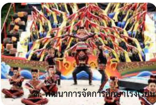
๓. พัฒนาการจัดการศึกษาโรงเรียน

๒.๒ เสริมสร้างความรู้ความเข้าใจเกี่ยวกับภัยคุกคามในรูปแบบใหม่ เช่น อาชญากรรม และความรุนแรงในรูปแบบต่างๆ สิ่งเสพติด ภัยพิบัติจากธรรมชาติ ภัยจากโรคอุบัติใหม่ ภัยจากไซเบอร์ ฯลฯ