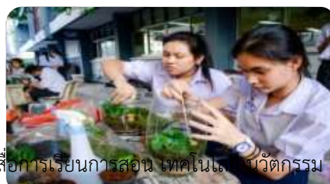
๒.๗ สนับสนุนการผลิต จัดทำ และใช้สื่อการเรียนการสอน เทคโนโลยี นวัตกรรม